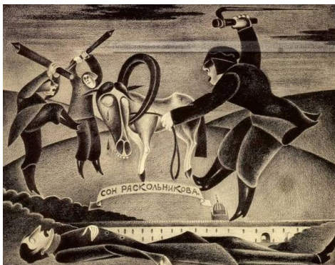
М. Шемякін. Ілюстрації до роману «Злочин і кара». 1964 р.

Творчості Михайла Шемякіна притаманні гротеск і фантасмагорії. Це засвідчують ілюстрації до роману Ф. Достоевського «Злочин і кара».