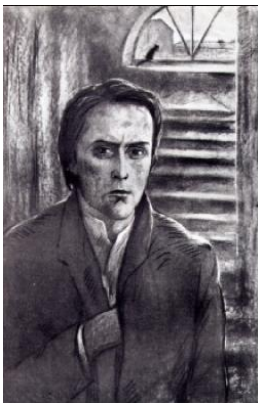
Ілля Глазунов. Раскольников на сходах

На другому портреті Раскольников зображений перед убивством старої лихварки. За спиною у нього – тридцять сходинок, що ведуть до його комірчини. Обличчя героя стривожене, молода людина із зловмисним поглядом дивиться ніби у глиб себе.