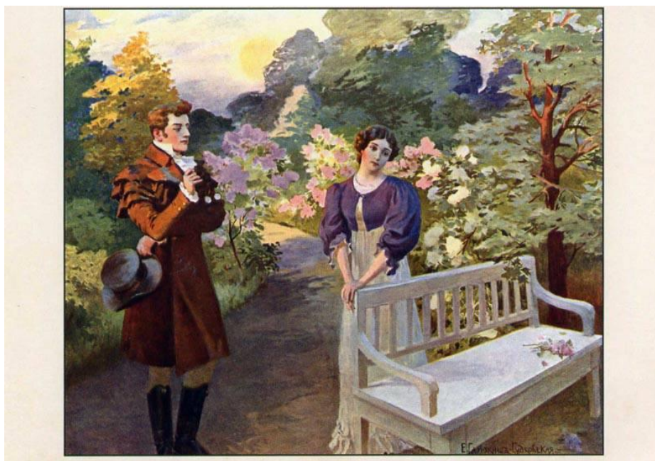
О. Самокиш-Судковська. Євгеній та Тетяна. Ілюстрація до роману О. Пушкіна «Євгеній Онегін». 1908 р.

Цикл ілюстрацій Олени Самокиш-Судковської , створений на початку ХХ століття, відтворює атмосферу минулого, але зображення персонажів були занадто романтизовані – вони були схожі на героїв популярних любовних романів того часу.