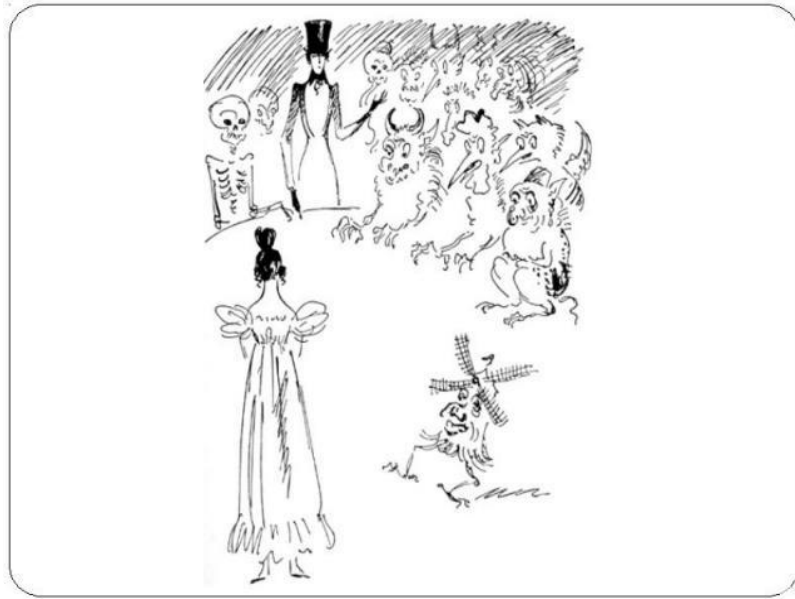
М. Кузьмін. Ілюстрація до роману О. Пушкіна «Євгеній Онегін». 1933 р.

він виконав серію малюнків пером у манері малюнків-начерків, що імітували манеру самого поета.