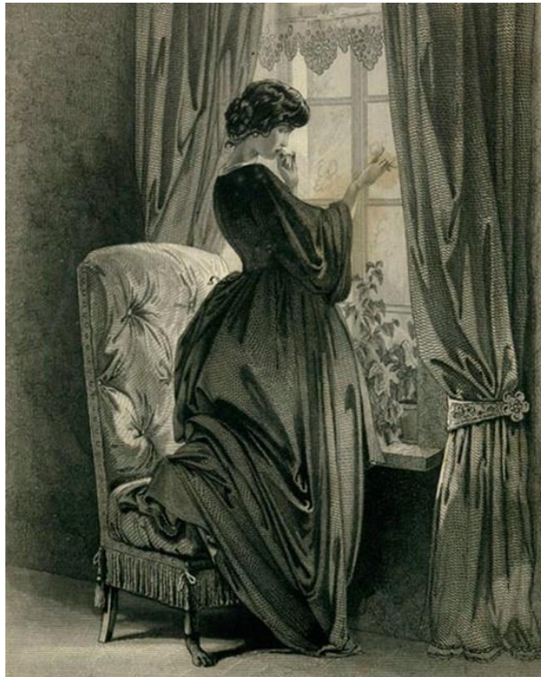
М. Мікешин. Тетяна. 1862 р.

Ілюстрації до роману О. Пушкіна з'явилися, коли твір ще не був завершений, але з перших проб художники відчували надзвичайну складність утілення ліричної стихії твору. Першим вдалим досвідом по праву вважається гравюра Михайла Мікешина «Тетяна» (1862). Видатний скульптор і художник зворушливо зобразив пушкінську героїню в момент складних душевних коливань.