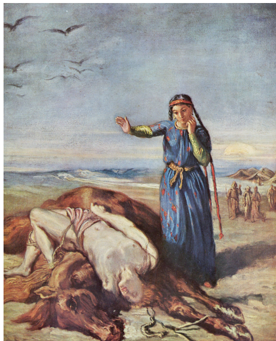
Теодор Шасеріо. Козачка біля тіла Мазепа, прив'язаного до коня. 1851 р.