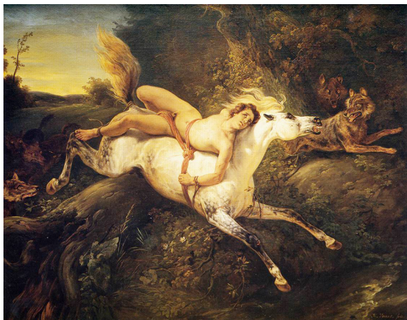
Орас Верне. Мазепа серед вовків. 1826 р.

2. Доведіть, що художники XIX століття романтизували образ українського гетьмана Івана Мазепа.