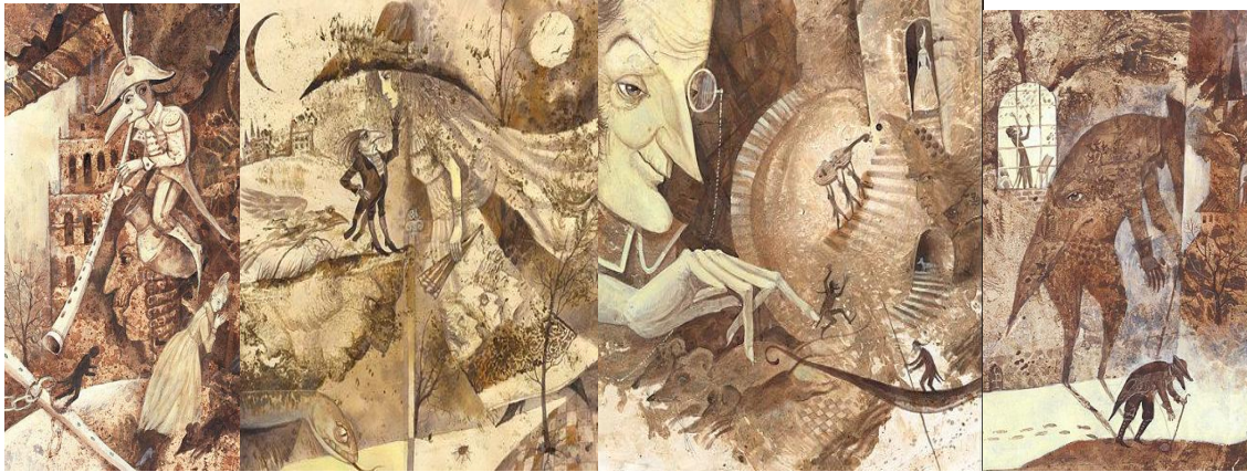
Віталій Дударенко. Ілюстрації до казки-новели Е.Т.А. Гофмана «Крихітка Цахес», 2013.