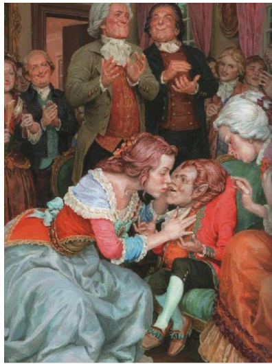
Денис Гордєєв. Ілюстрації до твору «Малюк Цахес» Е.Т.А.Гофмана, 2010