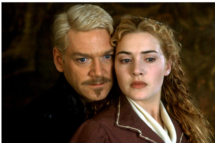
Кадри з фільму «Гамлет». Гамлет – Кеннет Брана. Офелія – Кейт Уїнслет. (Велика Британія, США, режисер Кеннет Брана, 1996)