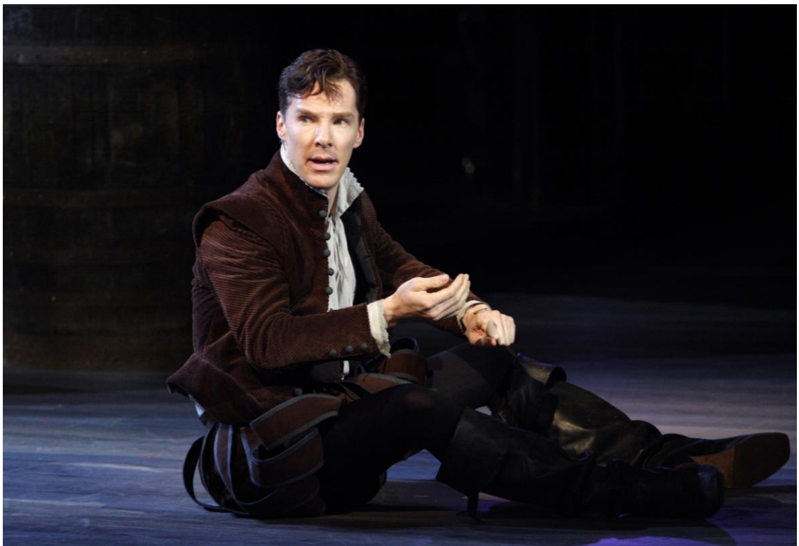
Кадри з фільму-вистави «Гамлет». Гамлет – Бенедикт Камбербетч. (Велика Британія, режисер Ліндсі Тернет, 2015)