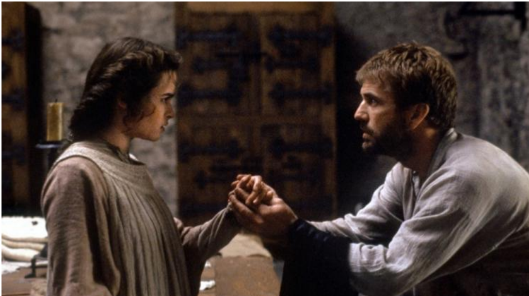
Кадри з фільму «Гамлет». Гамлет – Мел Гібсон, Хелена Бонэм Картер (США, Велика Британія, Франція, режисер Франко Дзеффіреллі, 1990)

Подивитись монолог Гамлета (Мел Гібсон):